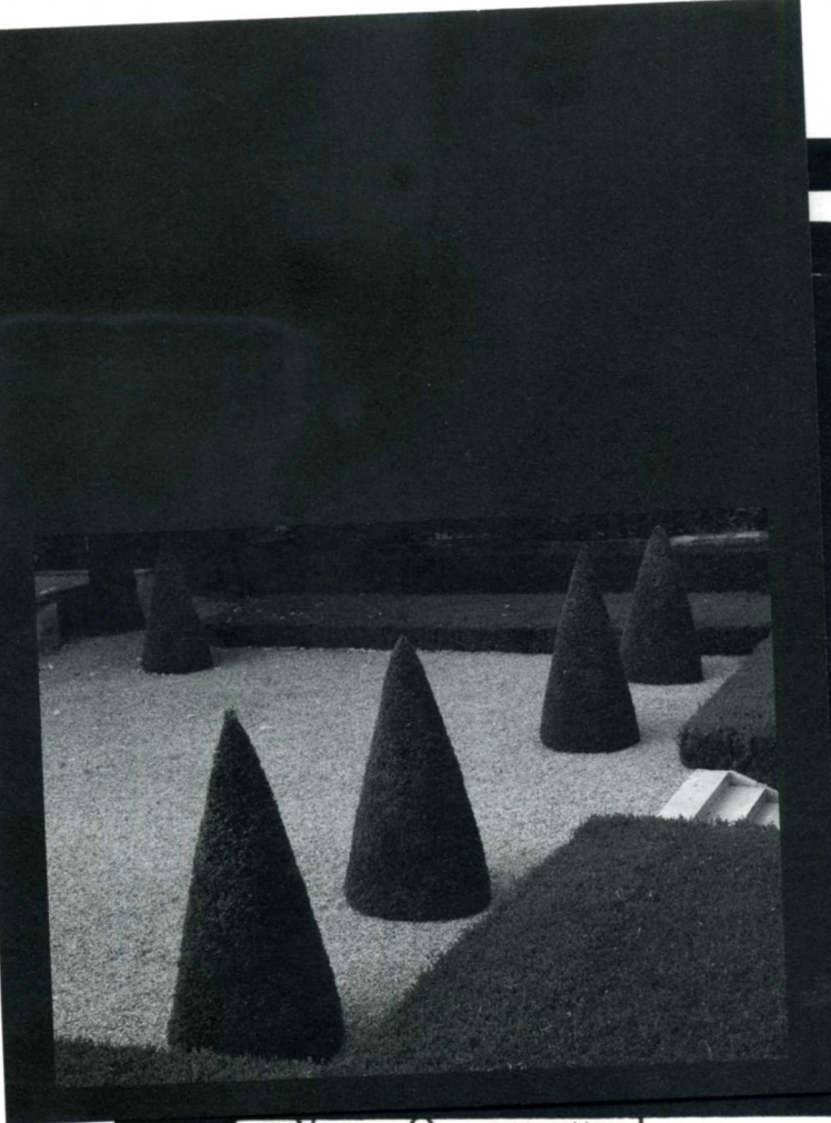
« Venez. On vous attend. »